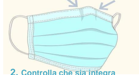
2. Controlla che sia integra