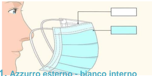
1. Azzurro esterno - bianco interno

Verifica che non ci siano difetti quali buchi o strappi. Non scambiare la tua mascherina con i compagni e non lasciarla in giro. Ci sono contenitori dove gettarle se devi cambiarla.